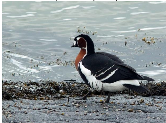
Roodhalsgans