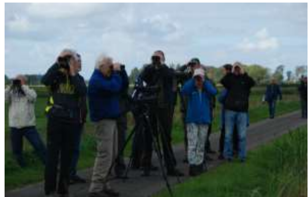
Zien we de zeearend?