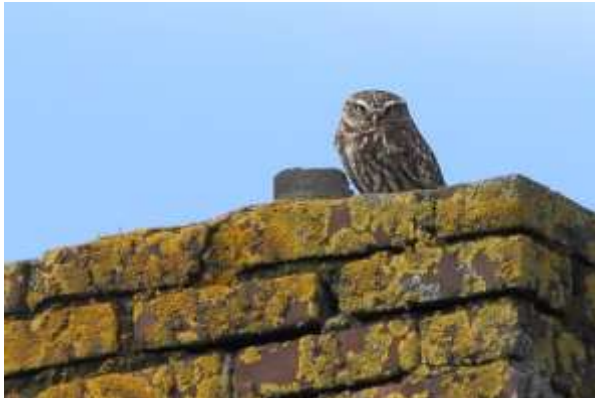
Steenuil, 22 maart 2015, Anderen

strandlopers werden enkele malen waargenomen. Temmincks strandlopers werden waargenomen in april in de Onlanden en in september in het Bargerveen. De enige Krombekstrandlopers werden gezien op 17 mei in de Onlanden en op 12 mei over de telpost Dwingelderveld. Zelfs de bonte strandloper werd verhoudingsgewijs dit jaar relatief weinig gezien. Bokjes werden met name in april, september en oktober op diverse plekken waargenomen.