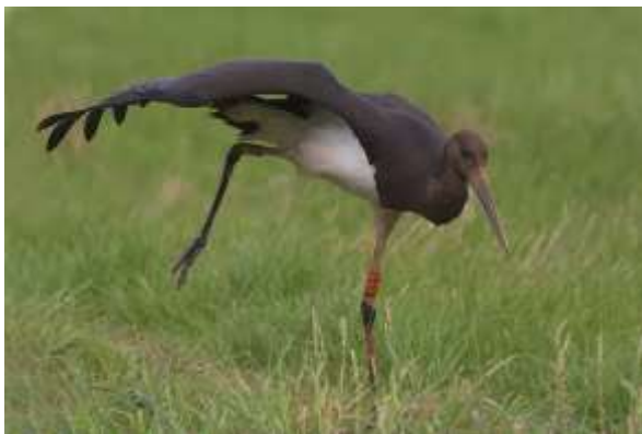
Zwarte Ooievaar

Dit jaar werd één koereiger waargenomen. Deze was aanwezig op 16 en 17 april bij Barger-Oosterveen. Kleine zilverreigers werden op enkele plekken als de Mepper Hooilanden, de Onlanden, Nieuw Balinge, Eestergroen en de zuidoevers van het Zuidlaardermeer gezien. Puperreigers werden regelmatig waargenomen in de omgeving van de Wieden en Weerribben. De enige waarneming buiten Zuidwest-Drenthe werd gedaan op 20 september nabij Buinen. Van mei tot september werden diverse zwarte ooievaars waargenomen. Een zwarte ibis werd op 26 april overvliegend over de A28 nabij Zuidwolde gezien.