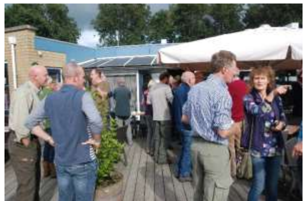
Napraten over de dag....