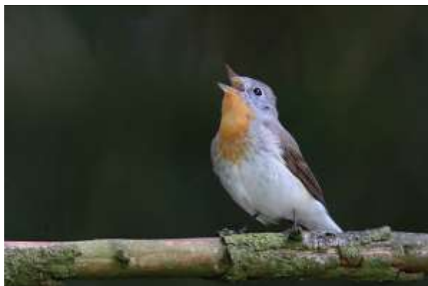
Kleine vliegenvanger, 24 mei 2015, Boswachterij Schoonloo

De eerste grauwe vliegenvanger , bonte vliegenvanger en wielewaal werden waargenomen op 27 april, 10 april en 25 april. Spectaculair was een adult zingend mannetje kleine vliegenvanger welke aanwezig was van 14 mei tot 14 juni in Boswachterij Schoonloo.