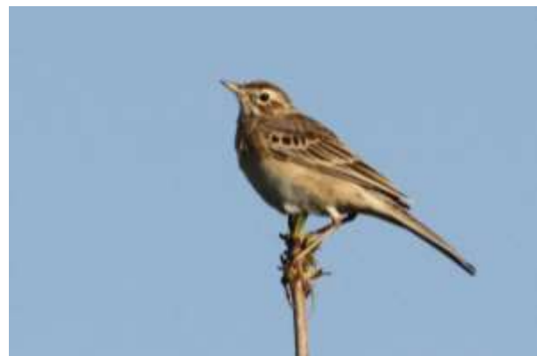
Grote pieper, 22 april 2015, Emmen - De Delftlanden

Op 18 mei, 20 juni, 23 juli en 23 augustus werden bijeneters bij respectievelijk het Drents-Friese-Wold, Roden, Dwingelderveld en Hoogeveen gezien. In april werden diverse hoppen waargenomen. Namelijk op 10 april bij Emmen, 10 april bij Kolderveense Bovenboer, op 20 april nabij Schoonebeek en 26 april in Meppel. Draaihalzen werden met name in april en mei gezien. De zeldzame strandleeuwerik was aanwezig op 24 april nabij Assen en 26 oktober vloog een vogel over het Echtenerzand, waarvan het geluid ook is opgenomen. De eerste huiszwaluw , oeverzwaluw , gele kwikstaart en gekraagde roodstaart werden waargenomen op 11 april, 7 april, 9 april, 9 april en laatste boerenzwaluw, oeverzwaluw, huiszwaluw en gekraagde roodstaart op 12, 3, 3 en 10 oktober. Rouw- , engelse- en noordse kwikstaarten werden in april en mei op diverse plekken gezien. De enige duinpieper vloog op 11 september over de telpost Dwingelderveld.