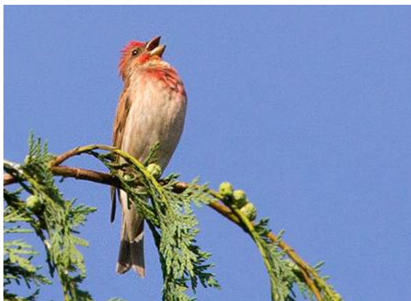
Roodmus, 30 mei 2014, Dwingeloo, Eelke Schoppers

20, 4, 12, 12 en 20 april. Op 10, 20 en 25 oktober werd een bladkoninkje waargenomen in respectievelijk Assen, bij het Echtenerzand en bij Aalden. De eerste grauwe vliegenvanger , bonte vliegenvanger en wielewaal werden waargenomen op 27 april, 4 april en 29 april. Een kleine vliegenvanger was op 25 mei aanwezig nabij Zorgvlied.