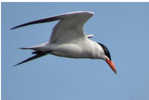
Reuzenster, 9 augustus 2014 de Onlanden, Tseard Mulder

Zwartkopmeeuwen werden onder anderen gezien in de Onlanden, Dwingelderveld en nabij Schipborg. Dwergmeeuwen waren in april en mei op diverse plekken aanwezig waarvan een groep van 29 vogels bij het Leekstermeer de grootste was. Geelpootmeeuwen werden gezien in juli en augustus bij Rolde en het Zuidlaardermeer. Van de zeer zeldzame lachstern werden twee waarnemingen gedaan, namelijk op 8 augustus in het Annermoeras en 12 augustus bij het Zuidlaardermeer.