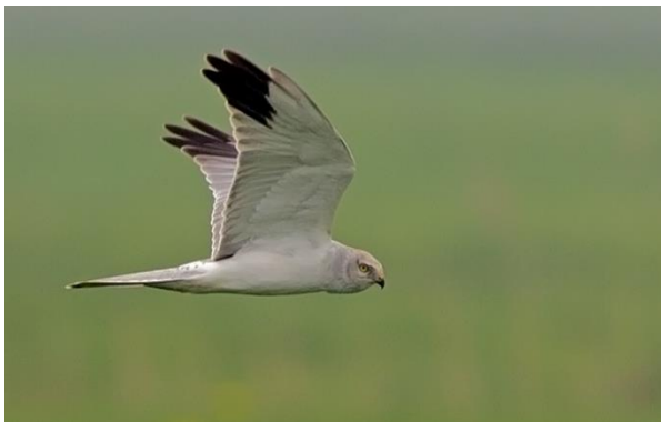
Steppenkiekendief, 5 april 2014 Buinerveen, Toy Jansen

Dit jaar werden twee keer kuifduikers waargenomen. Deze toch niet jaarlijks waargenomen soort was aanwezig op 23 april in Diependal en van 15 tot 22 juni op het Dwingelderveld. Een woudaap werd op 26 mei 's nachts in Diependal gehoord. Een andere zeldzame reiger, de koereiger , werd waargenomen op 16 april bij Hoogeveen en 25 mei in de Onlanden. Kleine zilverreigers werden in tegenstelling tot vorige jaren op diverse plekken gezien. Purperreigers werden regelmatig gezien in de omgeving van de Wieden en Weerribben en in de Onlanden.