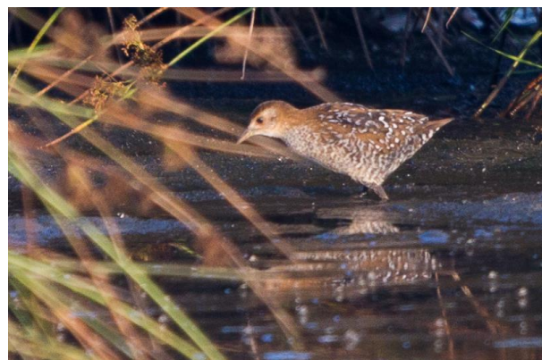
Kleinst waterhoen, 18 juli 2014 de Onlanden, Jan Lok

De eerste kwartel werd gehoord op 3 mei. Ook dit jaar waren er weer diverse kleinst waterhoentjes hoorbaar in de Onlanden. De eerste werd waargenomen op 15 mei. Bijzonder was de waarneming van een juveniele vogel welke op 18 juli werd gezien.