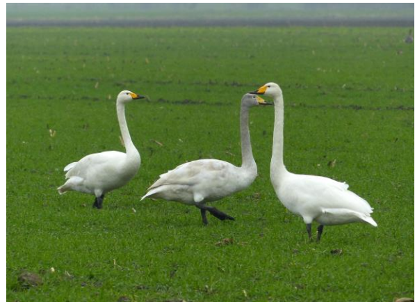
Drie van de 14 wilde zwanen op 1 december 2014. De laatsten .... Hero Moorlag

moeite had met het aanmaken van een account. Ik wilde hem daarmee wel helpen, maar heb hem voorlopig aangeraden zijn zoons van rond de 16 jaar in te schakelen. Dat zal hij doen. Boer D. aan de zuidkant van het Kremboongbos laat eveneens zijn zoon een account aanmaken en het schadeformulier invullen. Dan is er nog boer K. die ook geen ganzen en zwanen op zijn land duldt. Alle drie klagen ze over dassen.