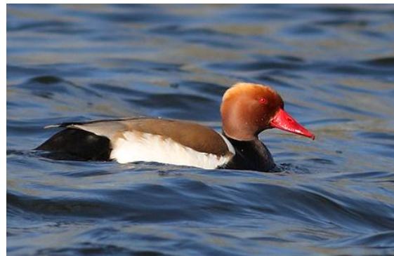
Krooneend, 30 april Hoornse Plas

Een Casarca was aanwezig op 25 september bij het Eelderdiep (Onlanden). Een paartje Krooneenden werd waargenomen van 30 april tot 4 mei op de Hoornse plas en op 5 oktober was een Witoogend aanwezig nabij Havelte.