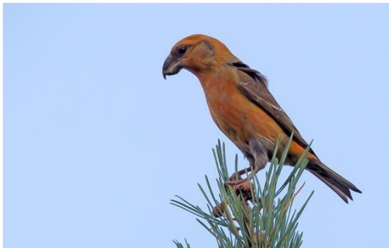
Grote Kruisbek, 23 oktober Drents-Friese Wold, Gerrit Kiekebos

Bijzonder was de aanwezigheid van een Bladkoning op 16 oktober in Paterswolde, 18 oktober in Emmen en van 18 tot 20 oktober in Norg. De laatste waarneming in Drenthe dateerde alweer van 2010. Op 15, 12, 26 en 12 april werden de eerste Fluiters , Fitissen , Grauwe en Bonte vliegenvangers waargenomen. Bijzonder was een zingend mannetje Kleine Vliegenvanger welke aanwezig was op 20 mei nabij Drouwen. De laatste waarneming van deze vogel in Drenthe dateerde alweer van 2001. Baardmannetje waren het hele jaar (met name) in de Matslootpolder (Onlanden) aanwezig. De eerste Grauwe Klauwier werd waargenomen op 5 mei en de eerste Wielewaal op 19 april.