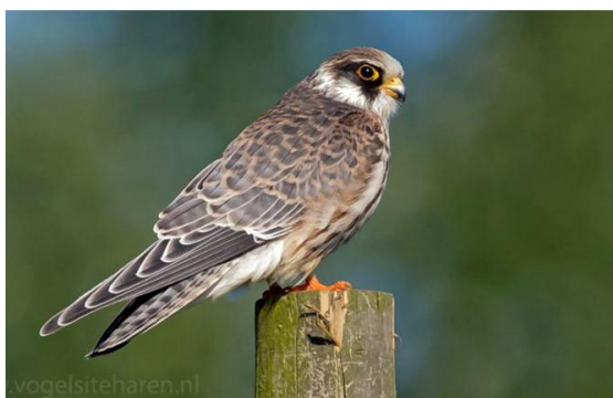
Roodpootvalk, 30 augustus Peizerweerding, Gerrit Kiekebos

Zilverplevier gezien. Kleine - , Krombek - en Temmincks Strandlopers werden op enkele plekken (m.n. in de Onlanden) waargenomen. Van 28 tot 31 juli en van 6 tot 7 oktober was een Gestreepte Strandloper aanwezig in de Peizerweerding (Onlanden). Bokjes werden m.n. gezien in de maanden maart en april. De enige Rosse Grutto's werden op 21 september in de Mepperhooilanden gezien. Voor Drentse begrippen grote aantallen Bosruiters werden in mei waargenomen in de Peizerweering (Onlanden). Op enkele dagen zaten hier soms meer dan 100 vogels. Op 11 juni was een Grauwe Franjepoot aanwezig nabij het Eelderdiep (Onlanden).